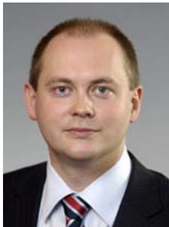
Mgr. Michal Hašek, předseda poslaneckého klubu ČSSD a místopředseda SR VZP